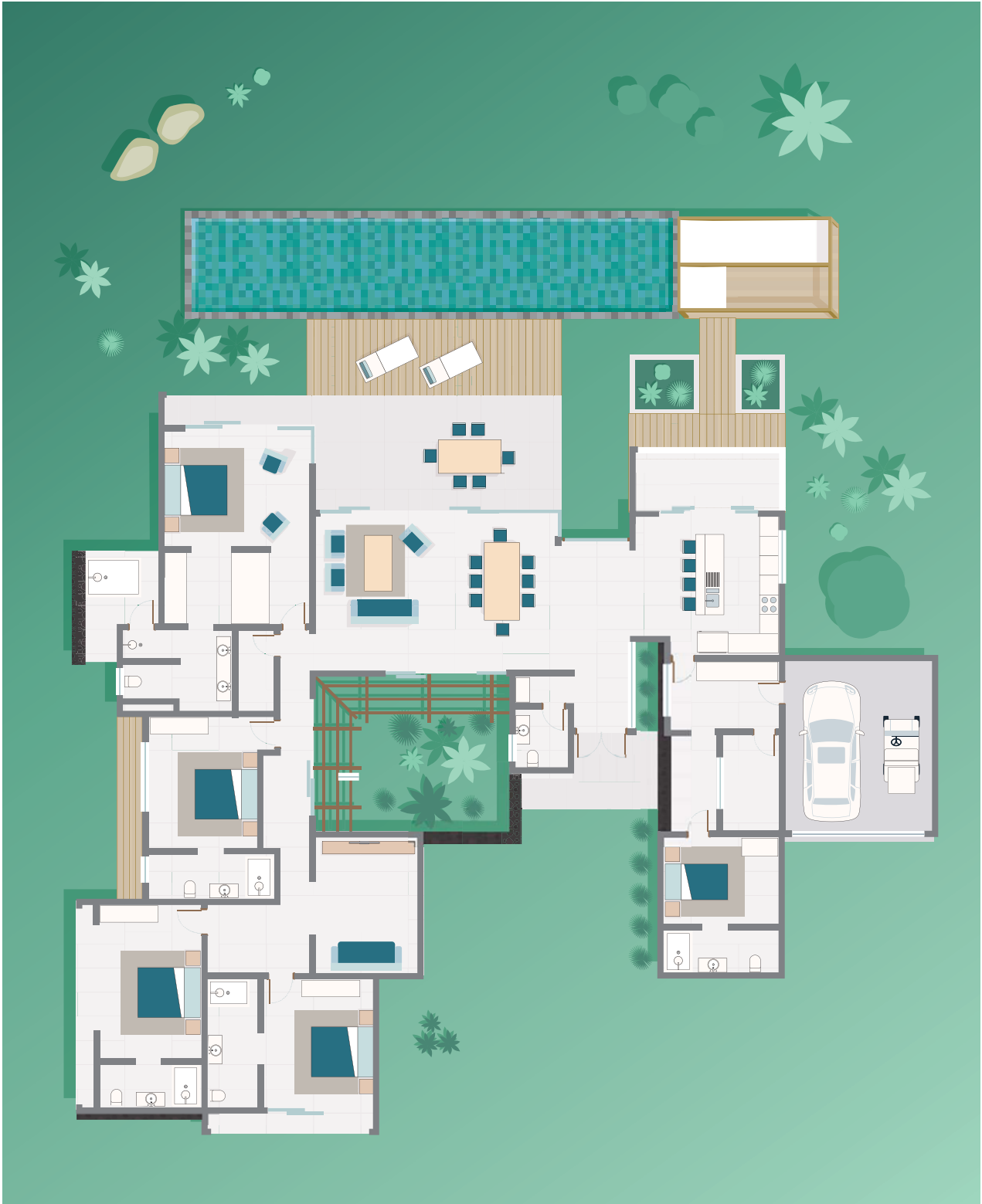
Rez-de-chaussée / Ground floor level.