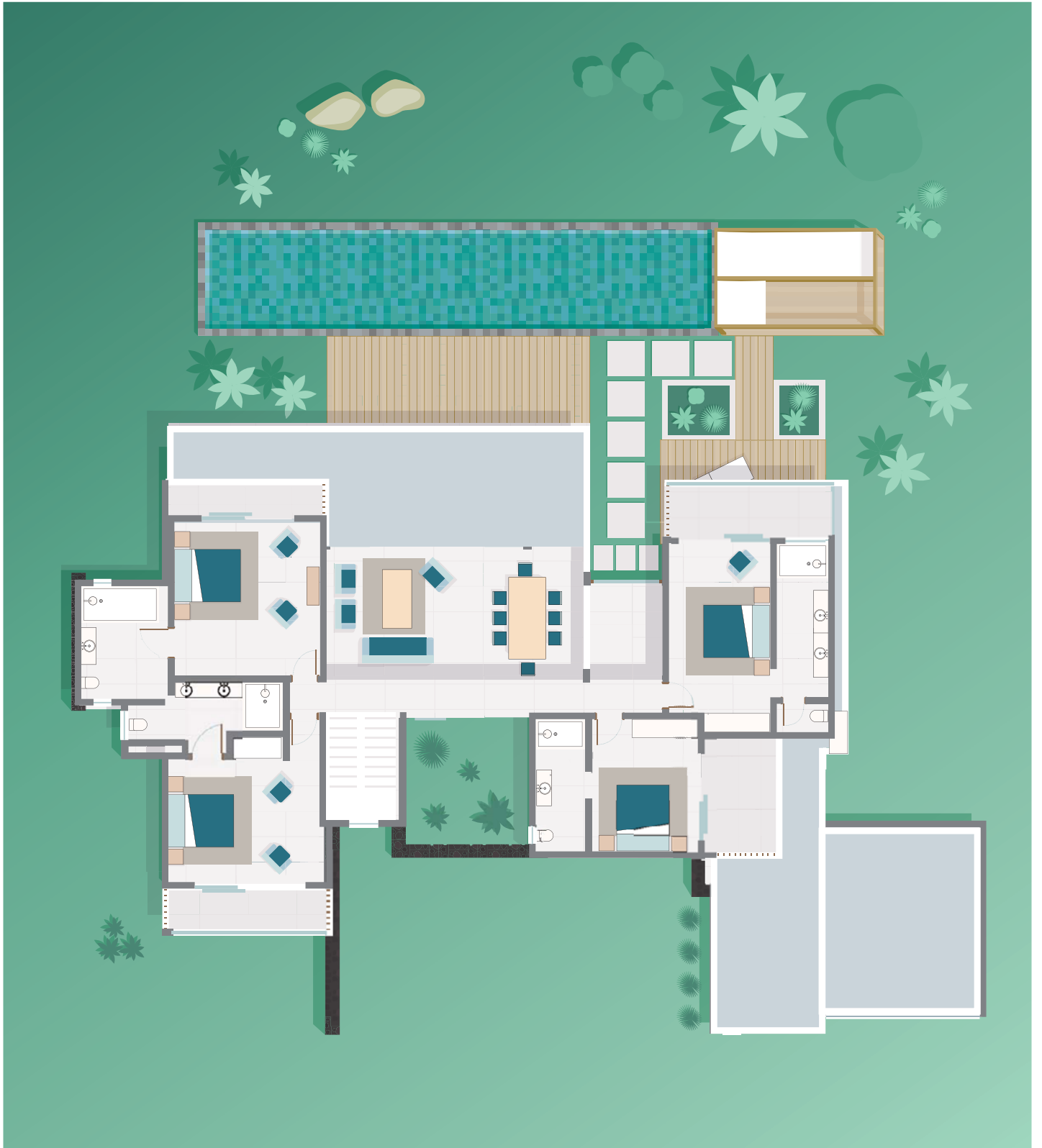
Premier étage / First floor level.