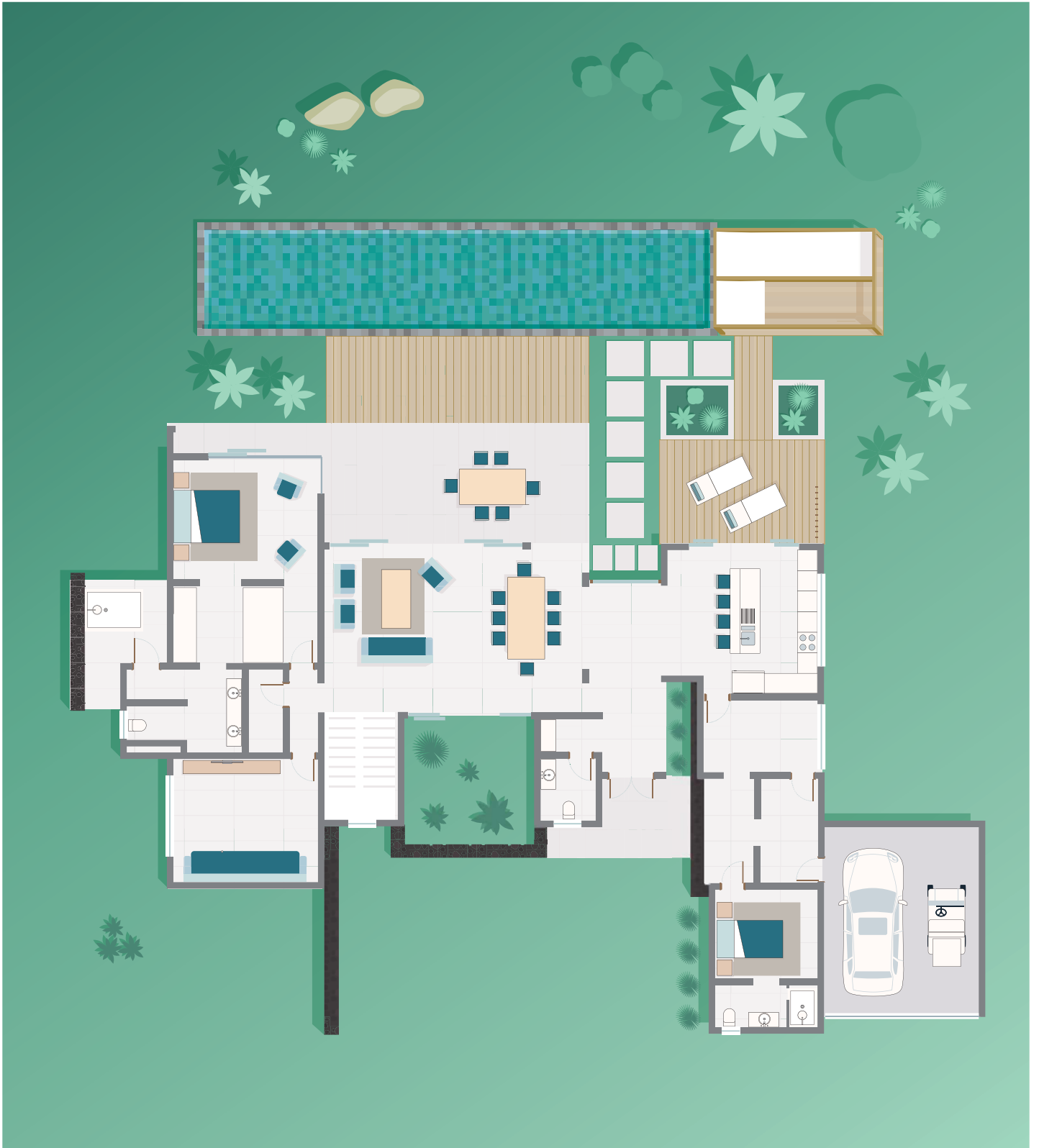
Rez-de-chaussée / Ground floor level.